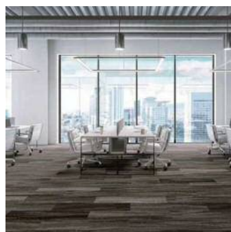
ウッディプランク