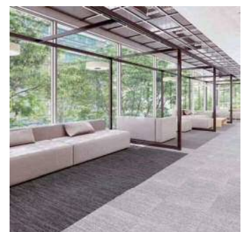
シフォンプレーン