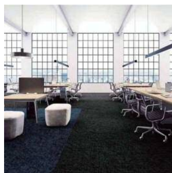
デジタルスラッシュ